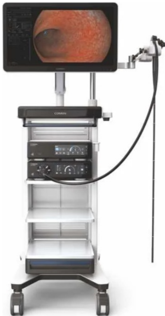
Фото COMEN EIS-2000 - Видеоэндоскопическая система

Отправьте запрос на коммерческое предложение и получите индивидуальные цены и сроки поставки