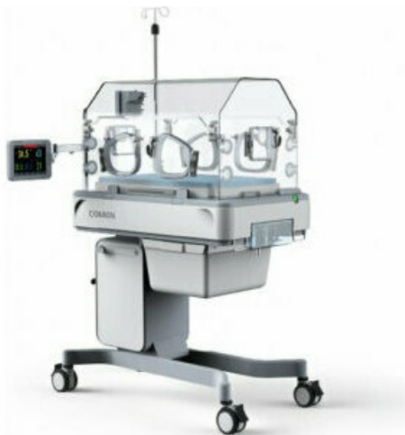
Фото Инкубатор для новорожденных COMEN B5

Тел: +7 499 638-26-78 | Email: sale@ru-comen.com | https://ru-comen.com