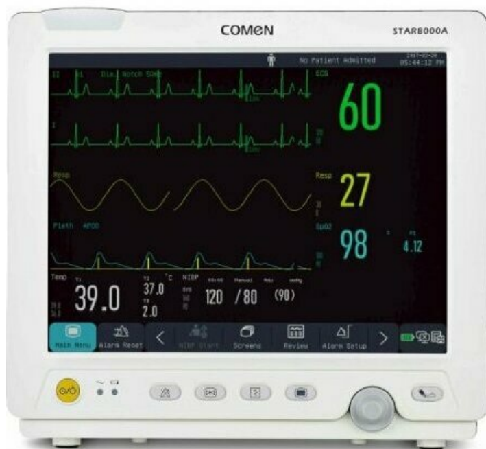
Фото COMEN STAR8000A - Монитор пациента

Отправьте запрос на коммерческое предложение и получите индивидуальные цены и сроки поставки