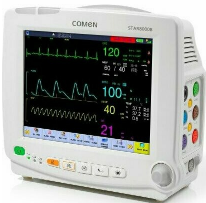
Фото COMEN STAR8000B - Монитор пациента

Отправьте запрос на коммерческое предложение и получите индивидуальные цены и сроки поставки