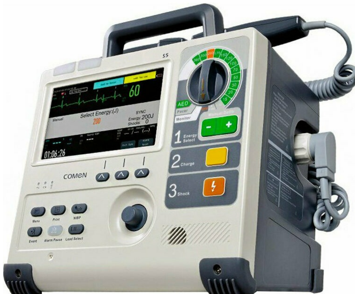
Фото Дефибриллятор-монитор COMEN S5

Отправьте запрос на коммерческое предложение и получите индивидуальные цены и сроки поставки