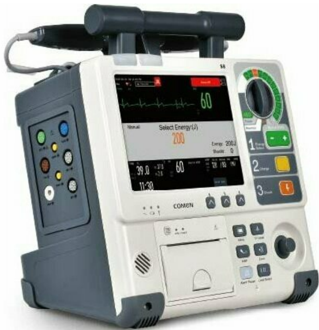
Фото Дефибриллятор монитор COMEN S8

Тел: +7 499 638-26-78 | Email: sale@ru-comen.com | https://ru-comen.com