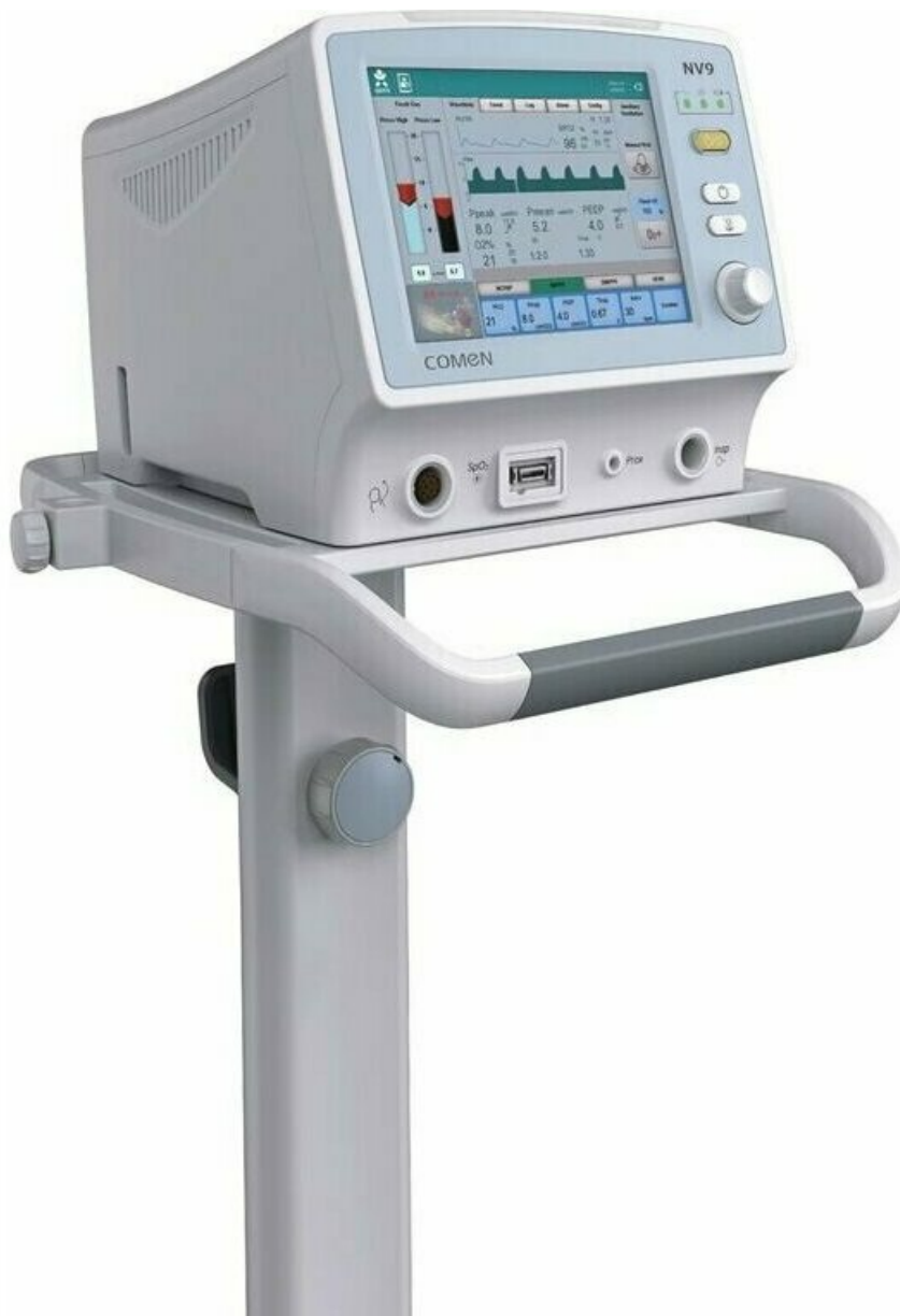
Фото Неонатальный аппарат ИВЛ COMEN NV9

Отправьте запрос на коммерческое предложение и получите индивидуальные цены и сроки поставки