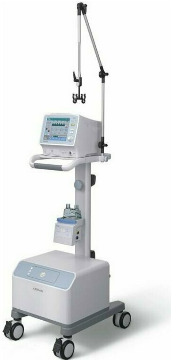
Фото Неонатальный аппарат ИВЛ COMEN NV7

Отправьте запрос на коммерческое предложение и получите индивидуальные цены и сроки поставки