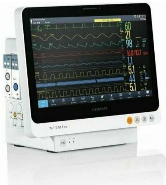
Фото Модульный монитор пациента COMEN N15M Pro

Отправьте запрос на коммерческое предложение и получите индивидуальные цены и сроки поставки