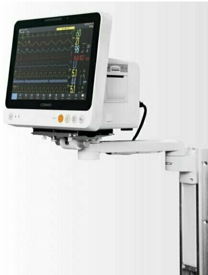
Фото Монитор пациента COMEN N12

Отправьте запрос на коммерческое предложение и получите индивидуальные цены и сроки поставки