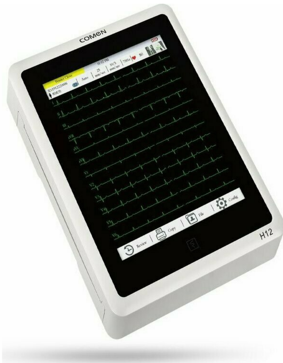
Фото Электрокардиограф COMEN H12

Отправьте запрос на коммерческое предложение и получите индивидуальные цены и сроки поставки