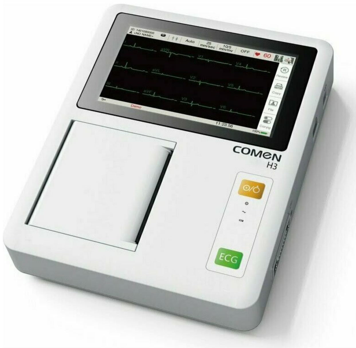
Фото Электрокардиограф COMEN H3

Отправьте запрос на коммерческое предложение и получите индивидуальные цены и сроки поставки