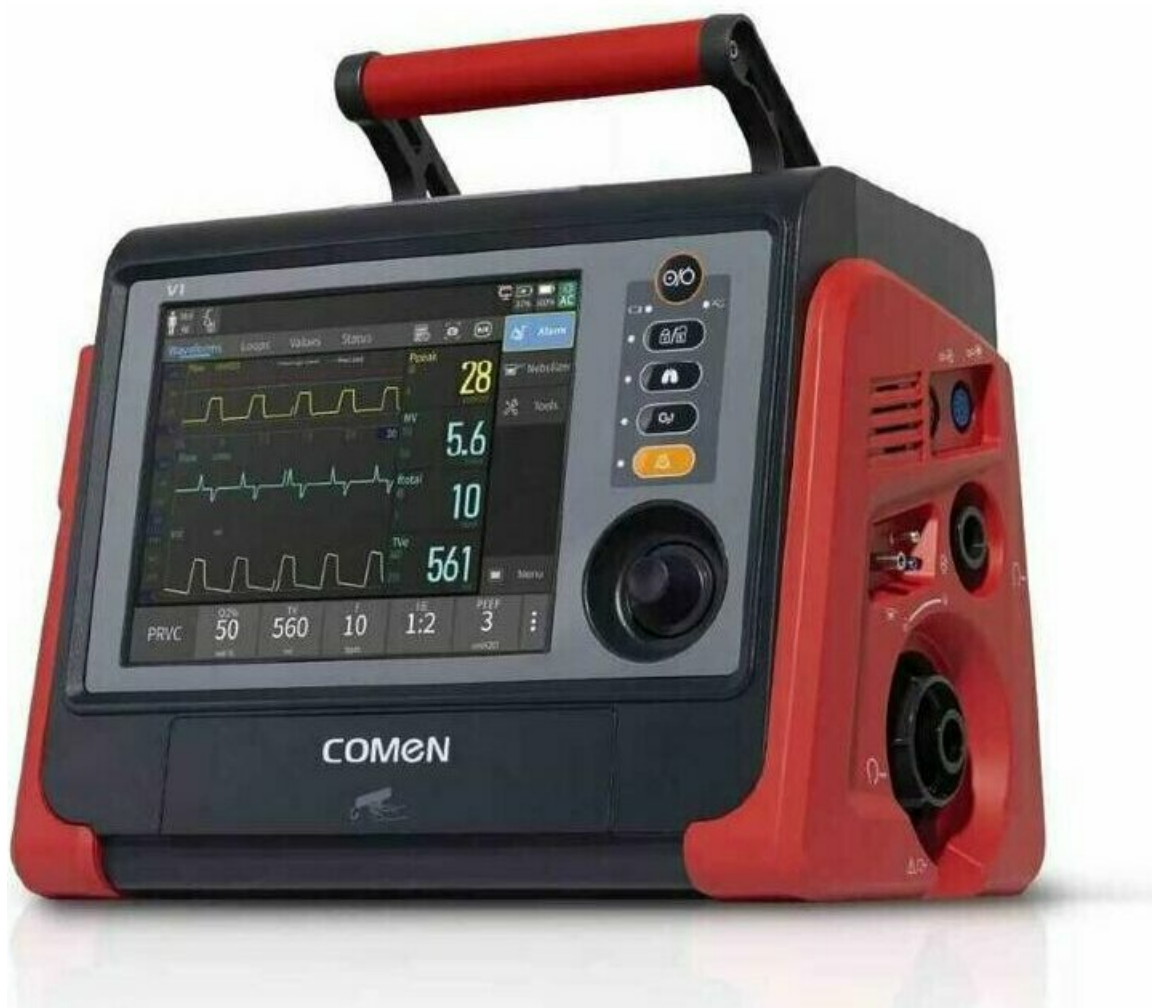
Фото Транспортный аппарат ИВЛ COMEN V1

Отправьте запрос на коммерческое предложение и получите индивидуальные цены и сроки поставки