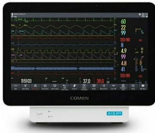
Фото Монитор пациента COMEN K15 Pro

Отправьте запрос на коммерческое предложение и получите индивидуальные цены и сроки поставки