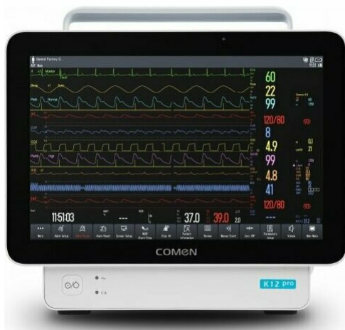
Фото Монитор пациента COMEN K12 Pro

Отправьте запрос на коммерческое предложение и получите индивидуальные цены и сроки поставки